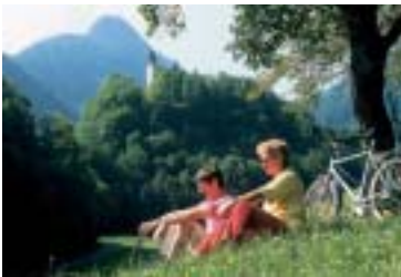
Idyllische Rast am Fuß des Karstein bei Bad Reichenhall

Der Radweg „Rund um Bad Reichenhall“ ist ein abwechslungsreicher Rundkurs um die Stadt Bad Reichenhall und bezieht die Orte Fiding, Bayerisch Gmain und Großgmain mit ein. Die beiden Leistungsvarianten bereichern diesen Radweg landschaftlich enorm und führen zu einigen herrlichen Aussichtspunkten des Bad Reichenhaller Talkessel. Der Streckenverlauf ist überwiegend auf Asphaltnebenstraßen und Sandwegen.