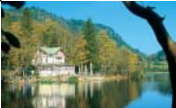
Der romantische Thumsee, im Sommer ein beliebter Badeplatz

Abkürzungsmöglichkeit über Badeseen-Radweg.